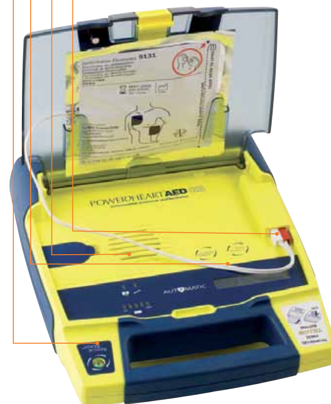
Powerheart AED G3 Plus

Begge tilsluttede elektroder kan enten placeres i positionen øverst til højre eller nederst til venstre på brystet.